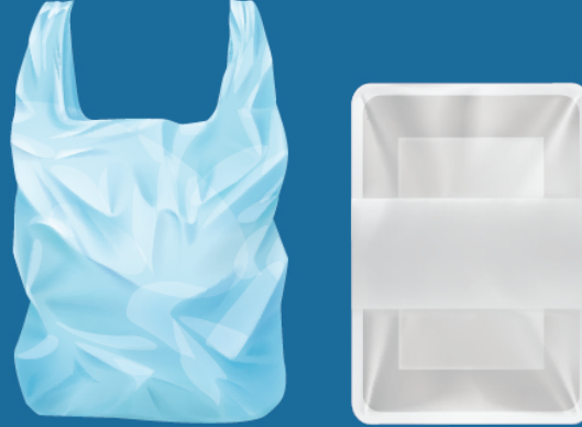
PLASTIC BAG/PACKAGING प्लास्टिक/पन्नी पैकेजिंग