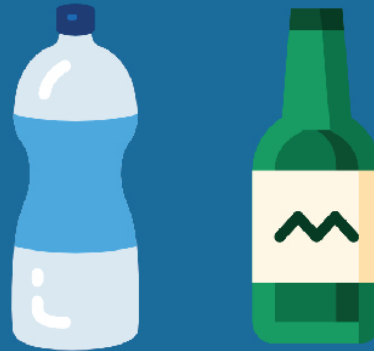
PLASTIC/GLASS BOTTLE प्लास्टिक/कांच की बोतल